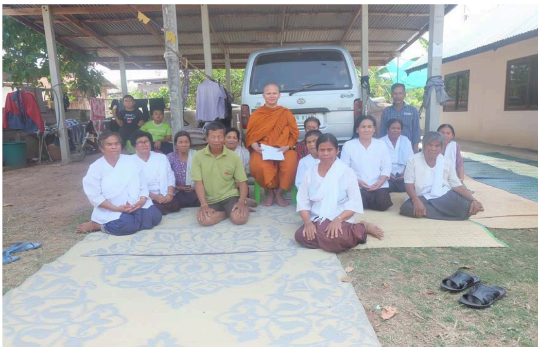
สัมภาษณ์กลุ่ม