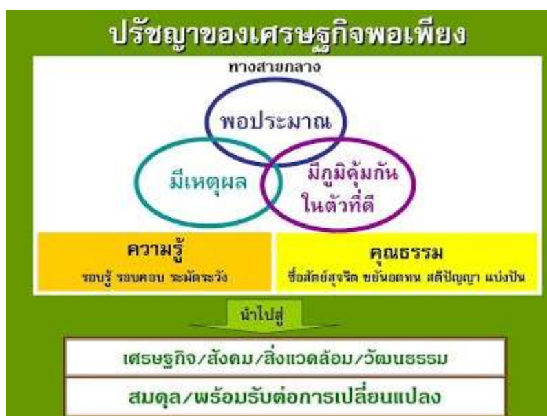
แผนภาพที่ ๒.๑ ปรัชญาเศรษฐกิจพอเพียง ๘๙

พัฒนาไปสู่เป้าหมายของตนเองได้ ทั้งนี้ เป้าหมายระบบชีววิทยาเน้นถึงความหลากหลายทางพันธุกรรม (Genetic Diversity) ระบบเศรษฐกิจเน้นถึงความต้องการขั้นพื้นฐาน ให้เกิดความเท่าเทียมกัน (Equity) และรักษาระบบสังคมเน้นความหลากหลายทางวัฒนธรรม (Cultural Diversity) มีสถาบันที่ยั่งยืนยาวนาน มีส่วนร่วมจากผู้คนต่างๆในสังคม ๘๘ เพราะฉะนั้น การนำเอาหลักปรัชญาเศรษฐกิจพอเพียงมาปรับประยุกต์ใช้นั้น ควรที่จะเริ่มตั้งแต่ระดับตัวบุคคลเองไปจนถึงระดับประเทศ ซึ่งทำให้การเป็นอยู่ของประชาชน มีคุณภาพ มีความสุข เตรียมพร้อมรับมือต่อสถานการณ์ต่างๆ ที่จะเกิดขึ้นในอนาคตได้