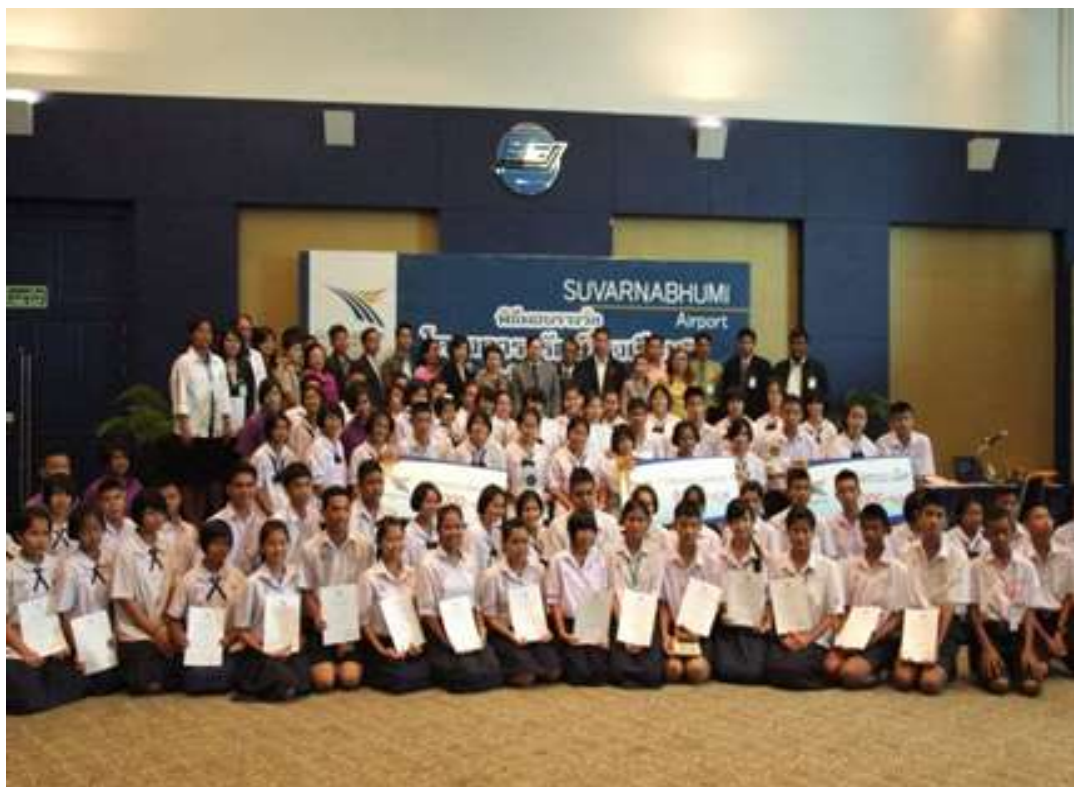
โครงการ “รักษัโรงเรียน”