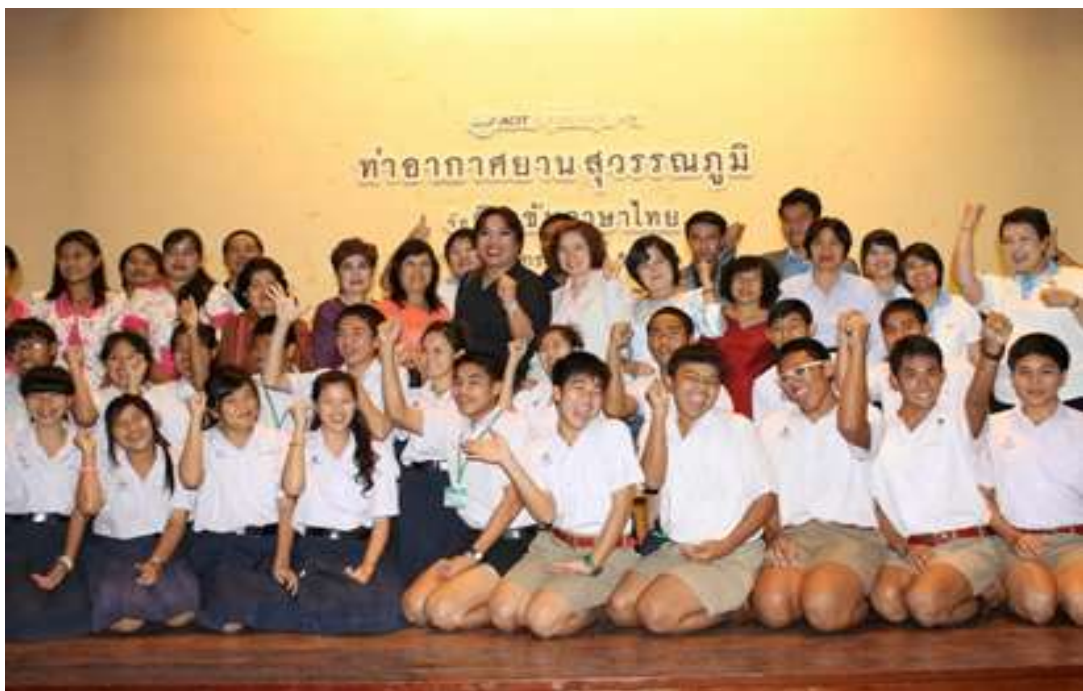
โครงการ “สุวรรณภูมิติวเข้มภาษาไทย”