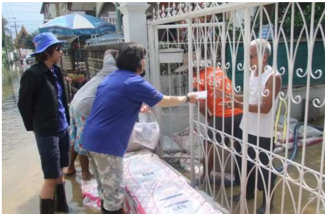
มอบเวชภัณฑ์ เพื่อช่วยเหลือผู้ประสบอุทกภัย ปี ๒๕๕๔ ในพื้นที่โดยรอบ ทสภ.