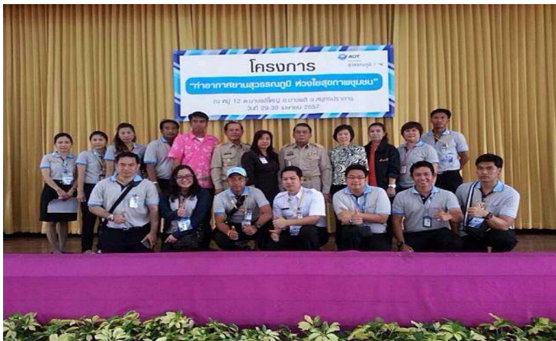
โครงการ “ทำอากาศยานสุวรรณภูมิ ห่วงใยสุขภาพชุมชน”