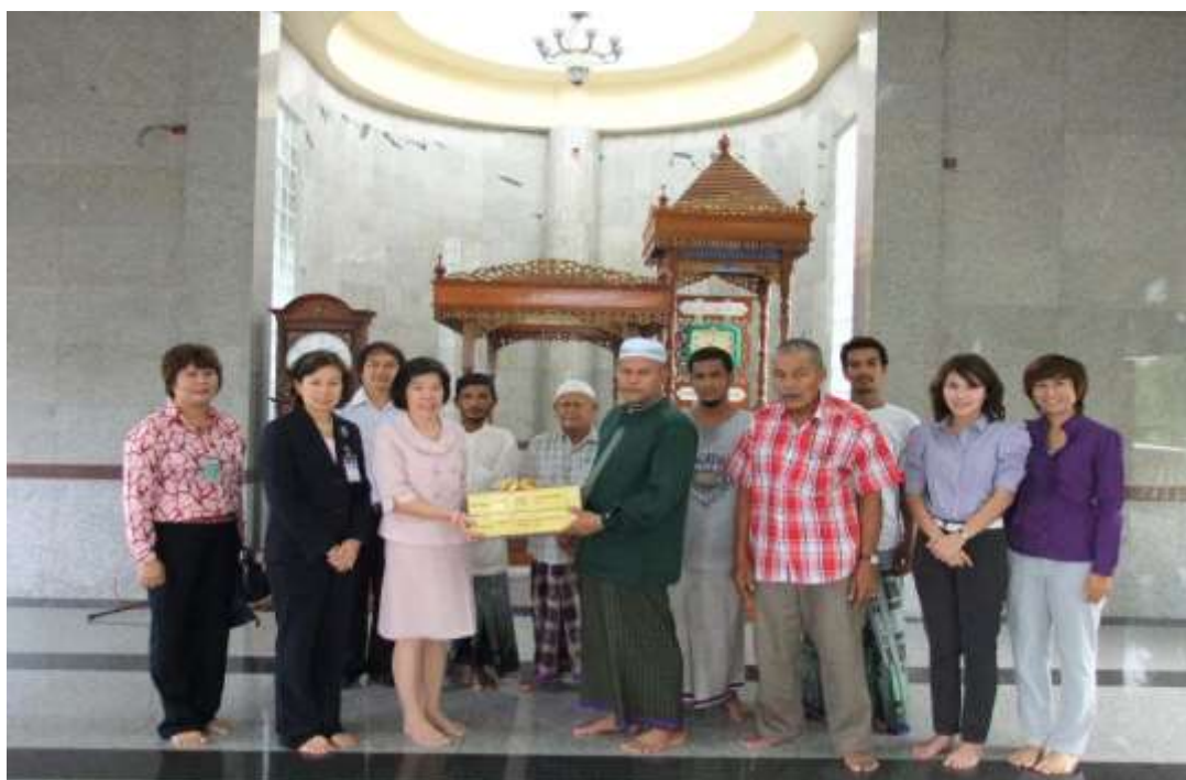
มอบอินทผลัมให้แก่มัสยิดโดยรอบ ทสภ. เนื่องในเทศกาลรอมฎอน