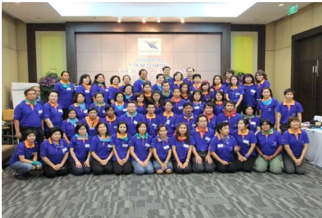
โครงการ “สัมมนาครูผู้สอนวิชาสุวรรณภูมิ”