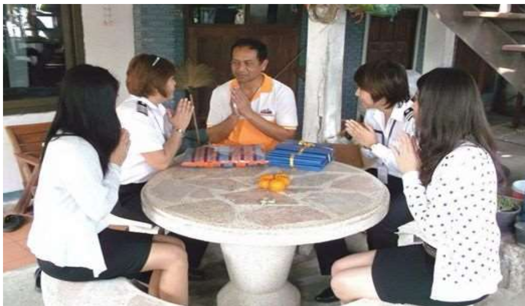
โครงการ “สวัสดิปีใหม่” ชุมชนโดยรอบ ทสภ.