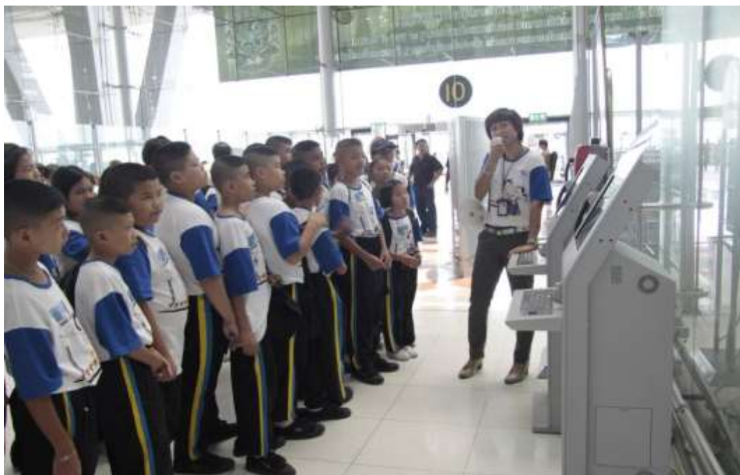
โครงการ “พาน้องท่องสุวรรณภูมิ”