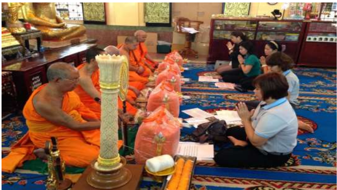
ถวายเทียนพรรษา เครื่องไทยธรรมและจตุปัจจัย วัดโดยรอบ ทสภ.