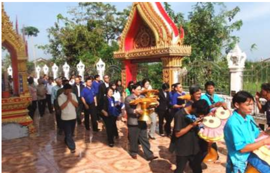
ทอดกฐิน วัดโดยรอบ ทสภ.