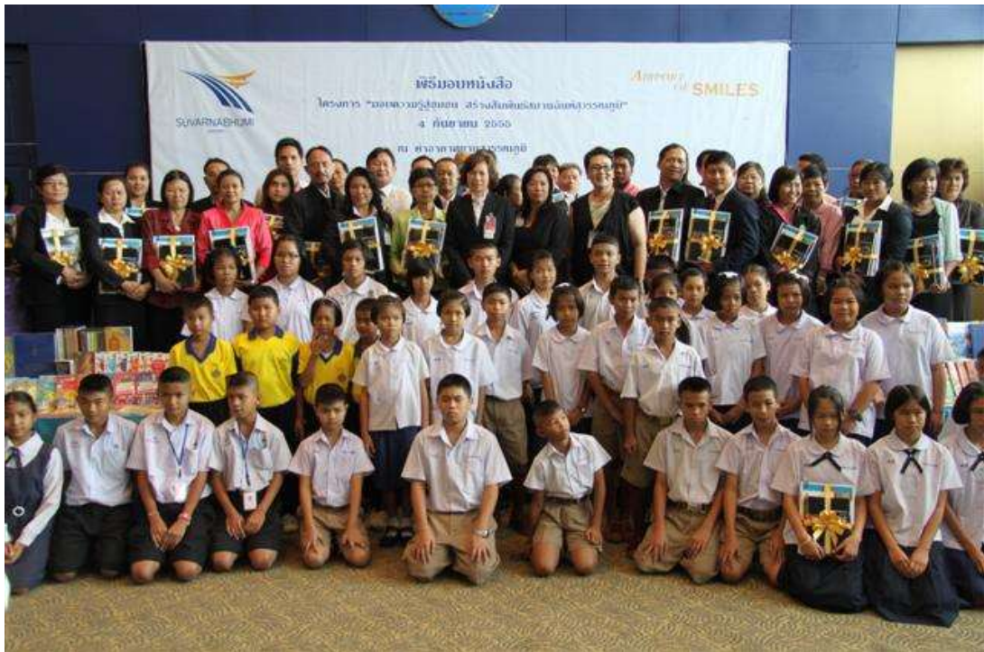
โครงการ “มอบความรู้สู่ชุมชน สร้างสัมพันธ์ สมานฉันท์สุวรรณภูมิ”