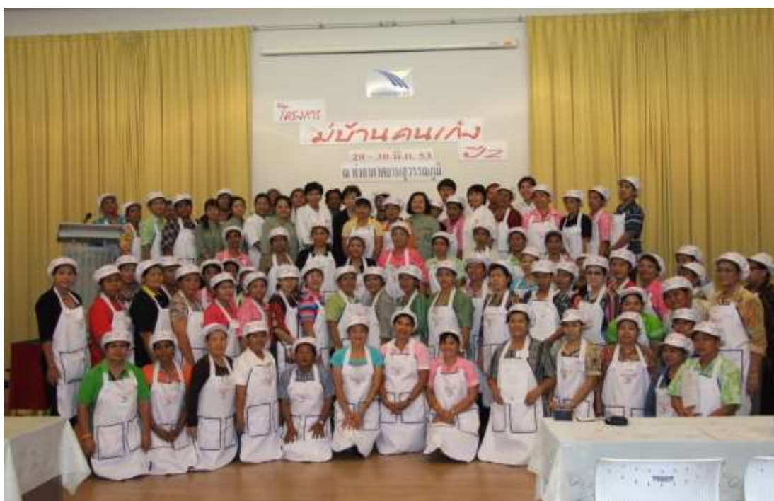
โครงการ “แม่บ้านคนเก่ง”