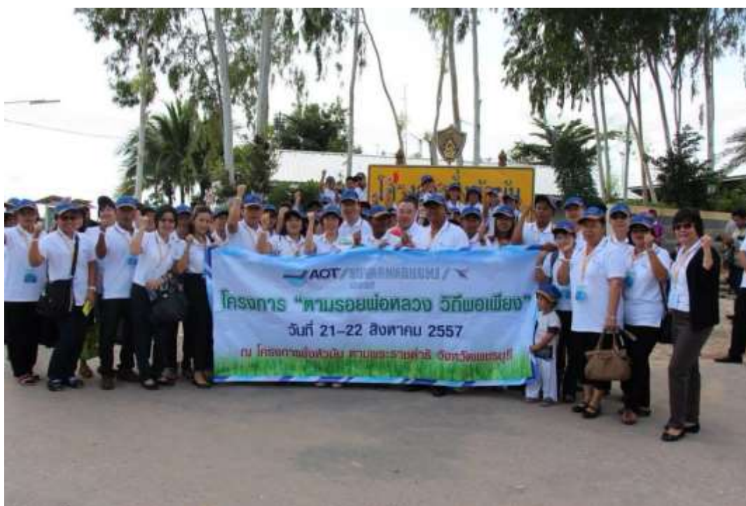
โครงการ “ตามรอยพ่อหลวง วิถีพอเพียง”