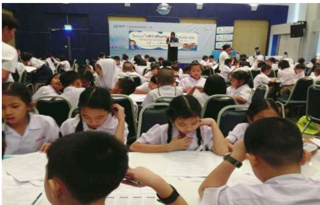
โครงการ “เยาวชนคนเก่ง”