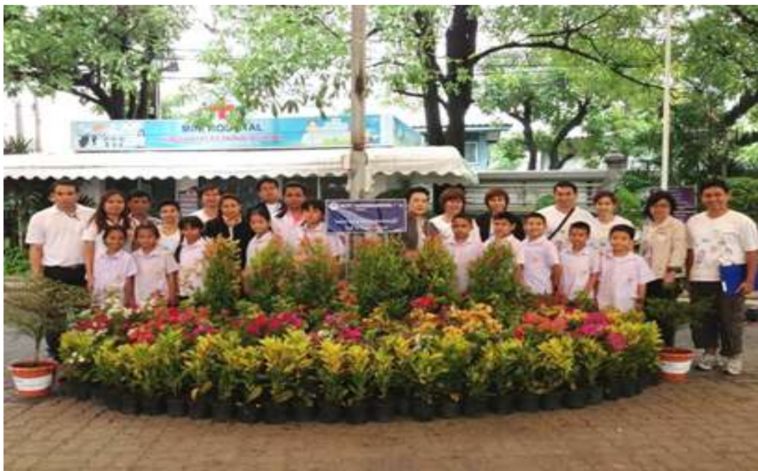
โครงการ “เพิ่มพื้นที่สีเขียวโรงเรียนโดยรอบ ทสภ.