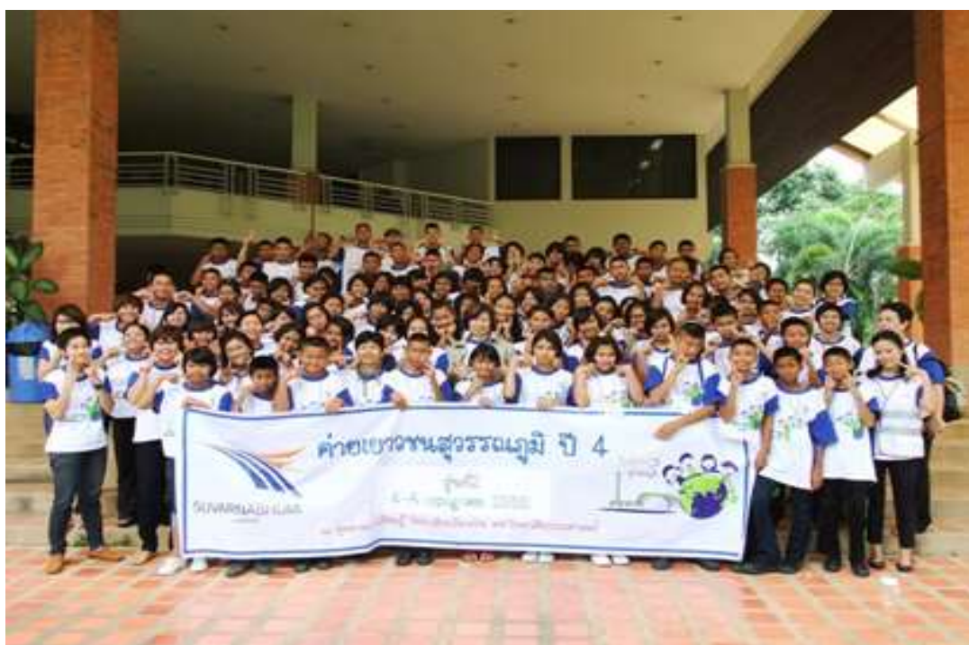
โครงการ “ค่ายเยาวชนสุวรรณภูมิ”