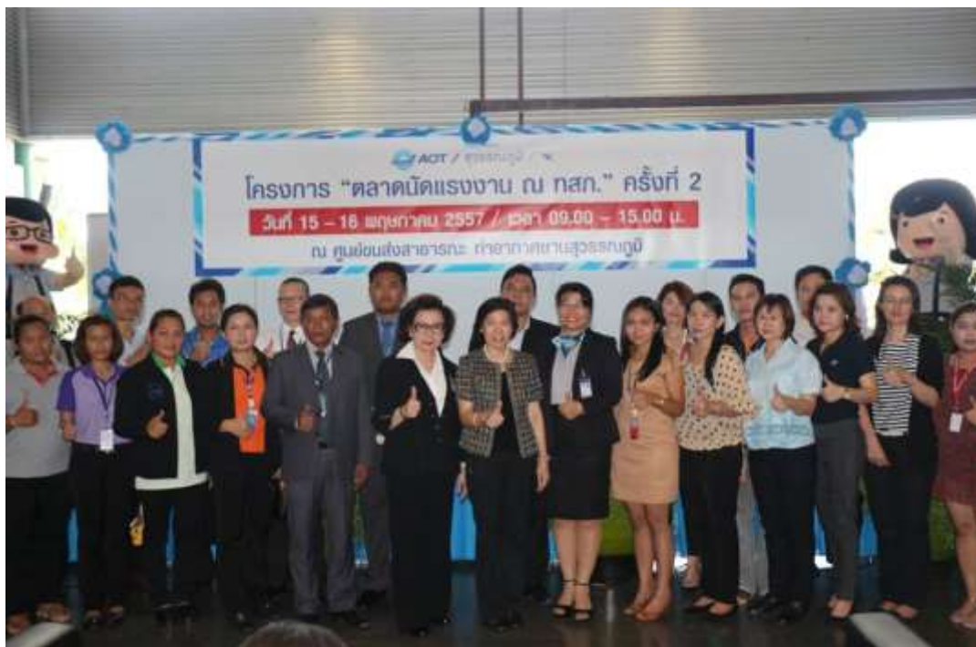
โครงการ “ตลาดนัดแรงงาน”