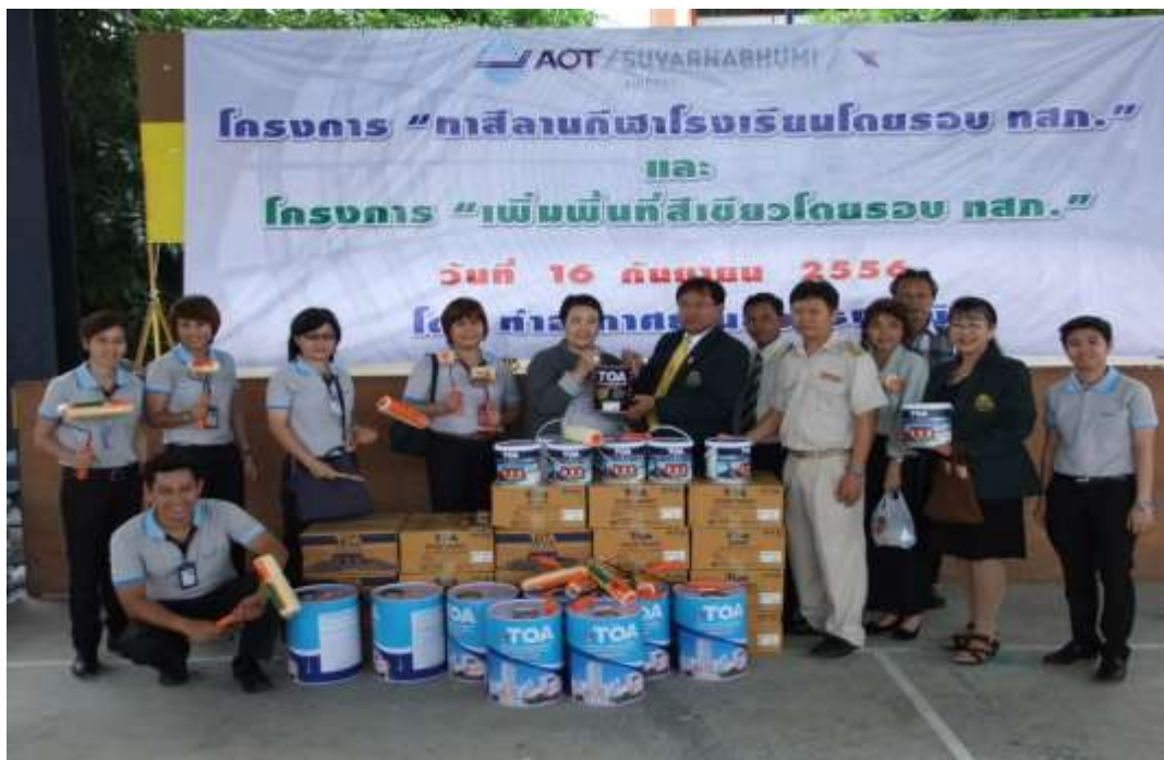
โครงการ “ทาสีลานกีฬา”โรงเรียนโดยรอบ ทสภ.