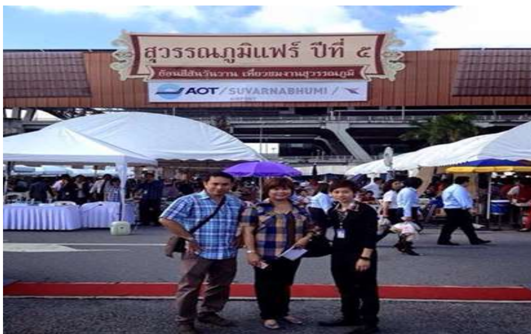
โครงการ “สุวรรณภูมิแฟร์”