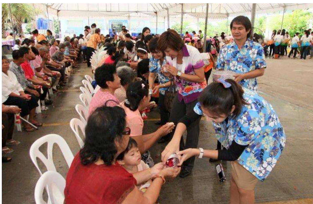
โครงการ “สวัสดีปีใหม่ไทยและรดน้ำขอพรชุมชน ”