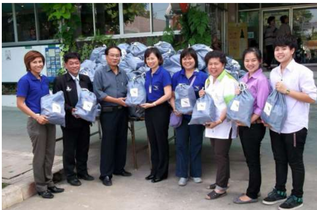
มอบถุงยังชีพ เพื่อช่วยเหลือผู้ประสบอุทกภัยปี ๒๕๕๔ ในพื้นที่โดยรอบ ทสภ.