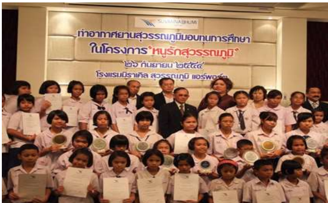
โครงการ “หนูรักสุวรรณภูมิ