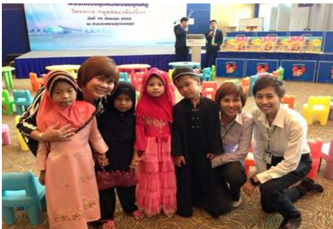
โครงการ “มุขสมองน้องจิ๋ว”