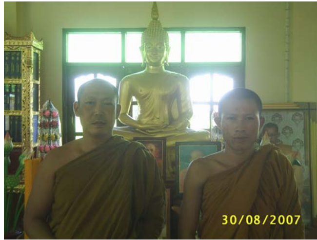
จากซ้าย ผู้วิจัยและพระเดชฤทธิ อธิฐฐาน โณ