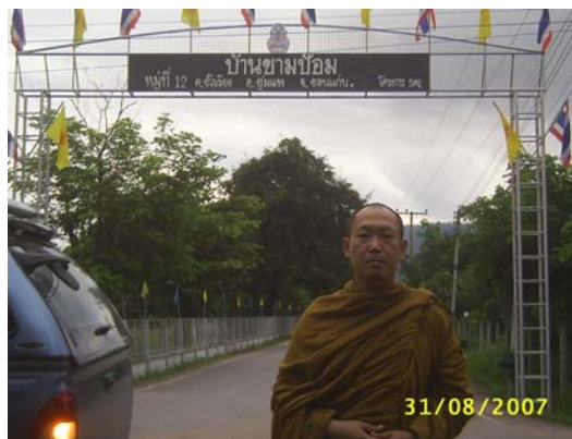
ทางเข้าบ้านขามป้อม ม.๑๒ ต.ข้าวเรียง อ.ชุมแพ จ.ขอนแก่น