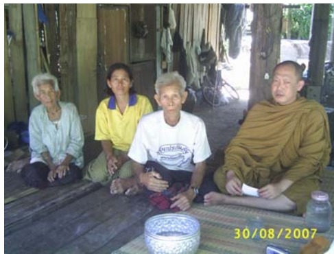
จากซ้าย คือ ยาย มารดาและตา ของพระเดชฤทธิ อธิฐฐาน โณ