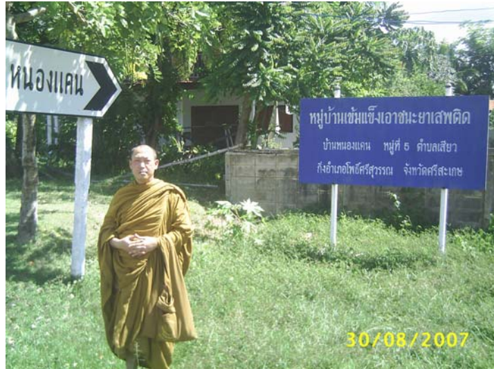
ทางเข้าบ้านหนองแค้น ม.๕ ต.เสียว อ.โพธิ์ศรีสุวรรณ จ.ศรีสะเกษ