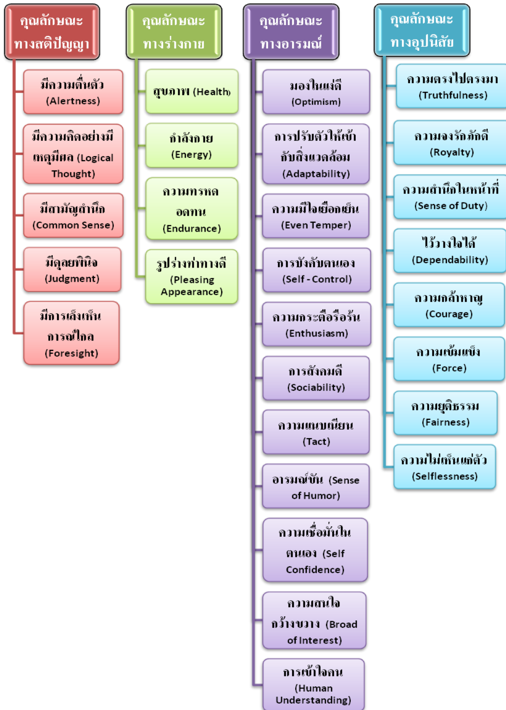
แผนภูมิที่ ๒ แสดงคุณสมบัติ (คุณลักษณะ) ของผู้นำ