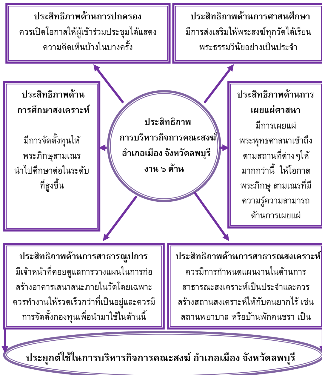
แผนภาพที่ ๔.๑ สรุปองค์ความรู้ที่ได้จากการวิจัย

จากการศึกษาเกี่ยวกับประสิทธิภาพการบริหารกิจการคณะสงฆ์ อำเภอเมือง จังหวัดลพบุรี ผู้วิจัยสรุปองค์ความรู้ (Body of Knowledge) ดังแสดงในแผนภาพที่ ๔.๑